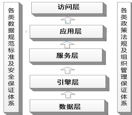
图 9.2.3 BIM 数据集成与管理平台系统架构简图